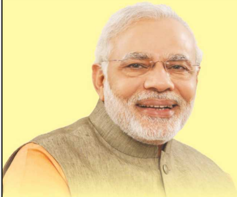
श्री नरेन्द्र मोदी जी मा. प्रधानमंत्री