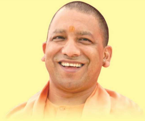
योगी आदित्यनाथ जी मा. मुख्यमंत्री, उ.प्र.